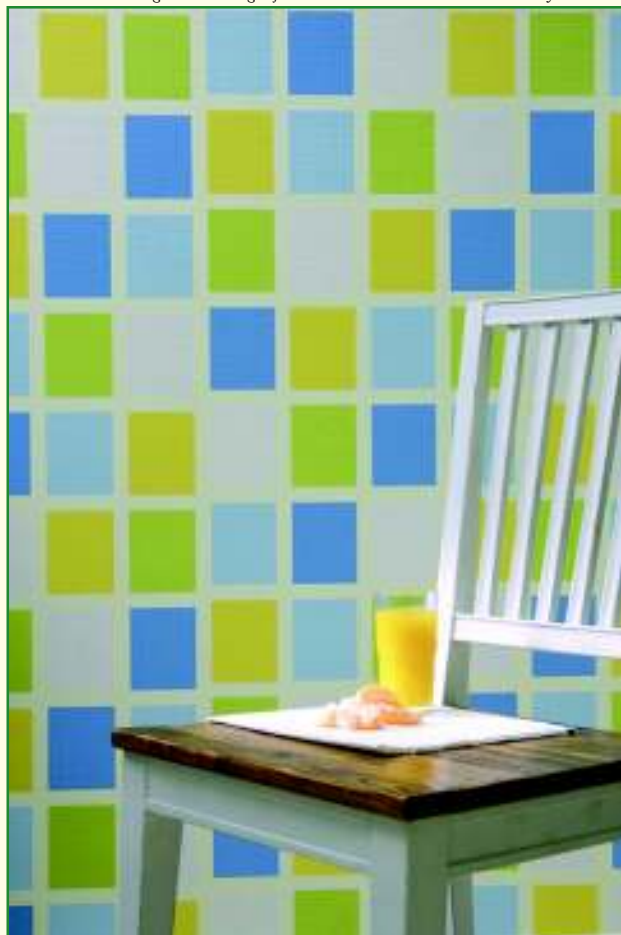
Behang in alle mogelijke vormen en motieven.

Voor papierbehang bestaat er het Duitse Blaue-Engel-label. Dit test het papier op emissies en gevaarlijke samenstellende stoffen (formaldehyde, zware metalen, andere...). Bovendien moet rijstpapierbehang met het Blaue Engel-label minstens voor 80 % uit recyclagepapier bestaan en ander behangpapier voor minstens 60%.